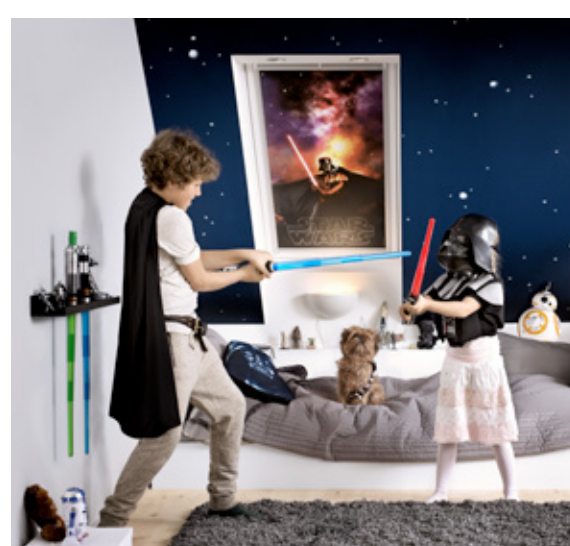
Dark Vador (coloris 4710)