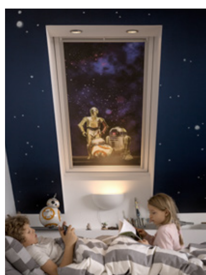
Robots (coloris 4713)