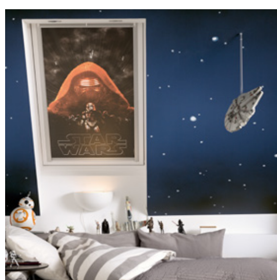
Kylo Ren (coloris 4712)