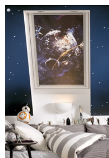
L'étoile de la mort (coloris 4711)

Les stores seront disponibles dans toutes les tailles. Prix public conseillé : 100,80€ TTC (taille 78 x 98 cm) - Prix au 01/02/2016