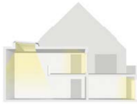
Extension en toit plat

Architectures adaptées à l'installation de verrières modulaires