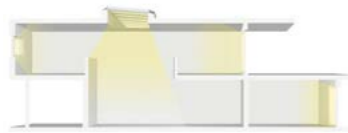
Maison en toit plat